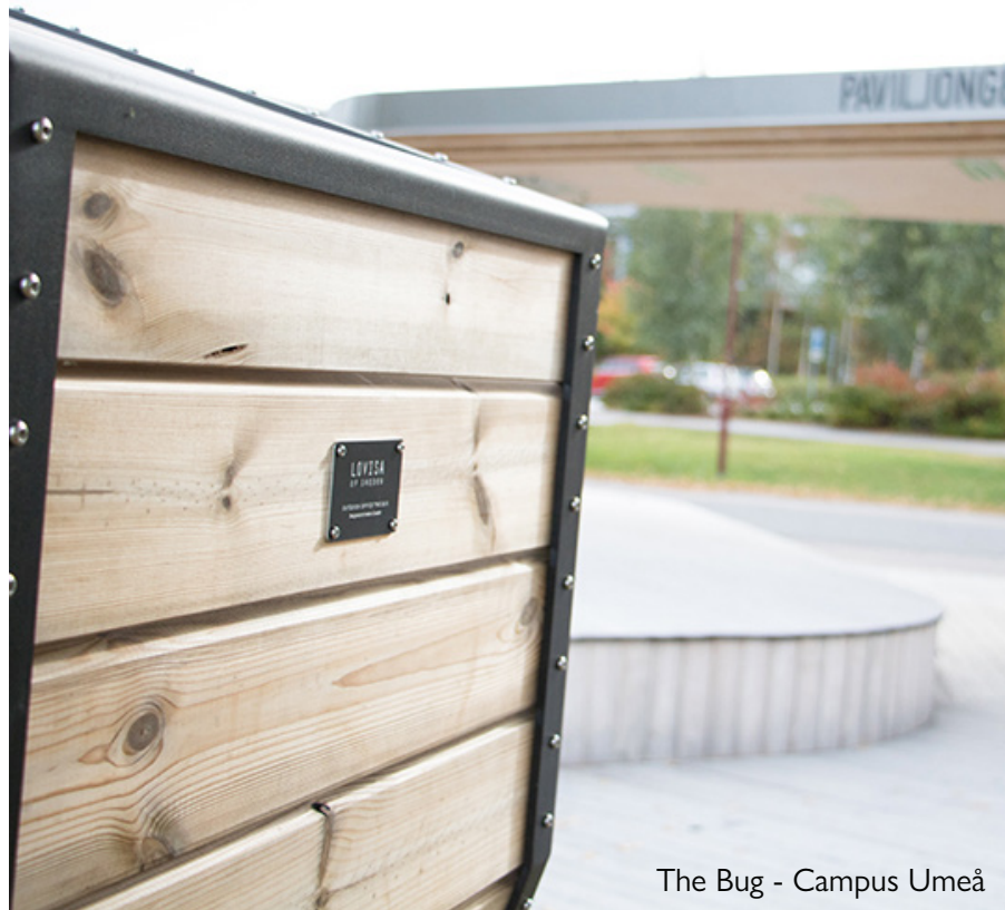
The Bug - Campus Umeå